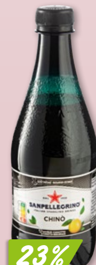
SanPellegrino aranciata ou chinotto 6 x 4