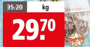
Salami Cremona Negroni petit