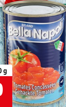
Tomates Bella Napoli concassées