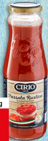
Passata rustica Cirio