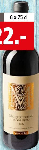
Montepulciano d'Abruzzo Villa d'Ora DOP 2022