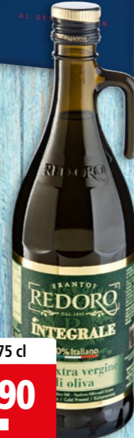
Huile d'olive extra vierge Redoro non filtrée