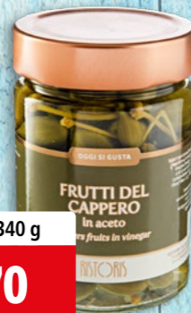
Fruits du câprier Ristoris