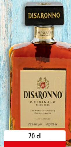
Disaronno Originale 28% vol.