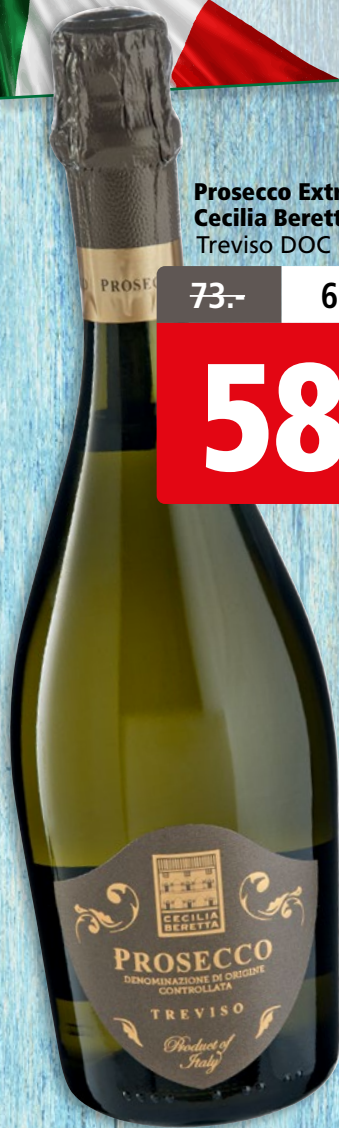
Prosecco Extra Dry Cecilia Beretta Treviso DOC