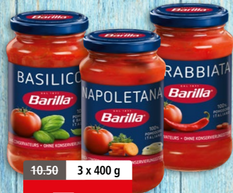
Sauce tomate Barilla diverses sortes