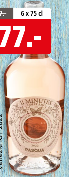
11 Minutes Pasqua Venezie IGT 2022