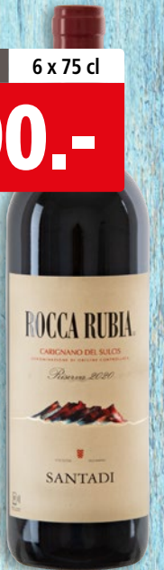
Carignano del Sulcis Riserva Rocca Rubia Santadi DOC 2020