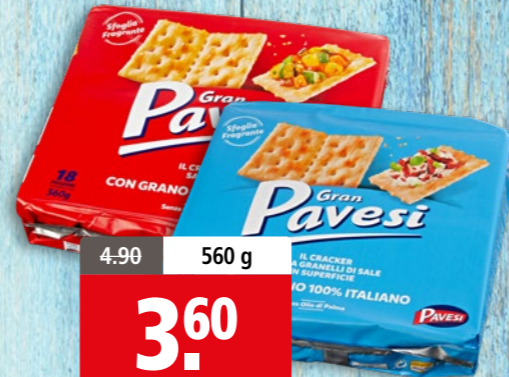
Crackers Gran Pavese sans ou avec grains de sel