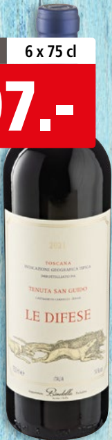
Le Difese Toscana IGT 2021