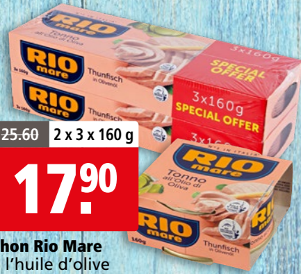
Thon Rio Mare à l'huile d'olive