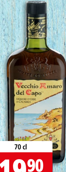
Vecchio Amaro del Capo 35% vol.