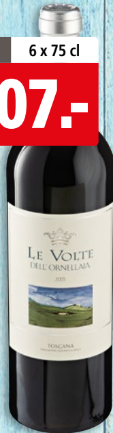
Le Volte dell'Ornellaia Toscana IGT 2021