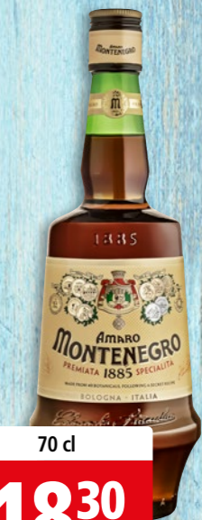
Amaro Montenegro 23% vol.