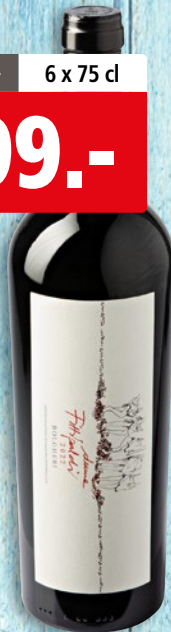
Donne Fittipaldi Bolgheri DOC 2022