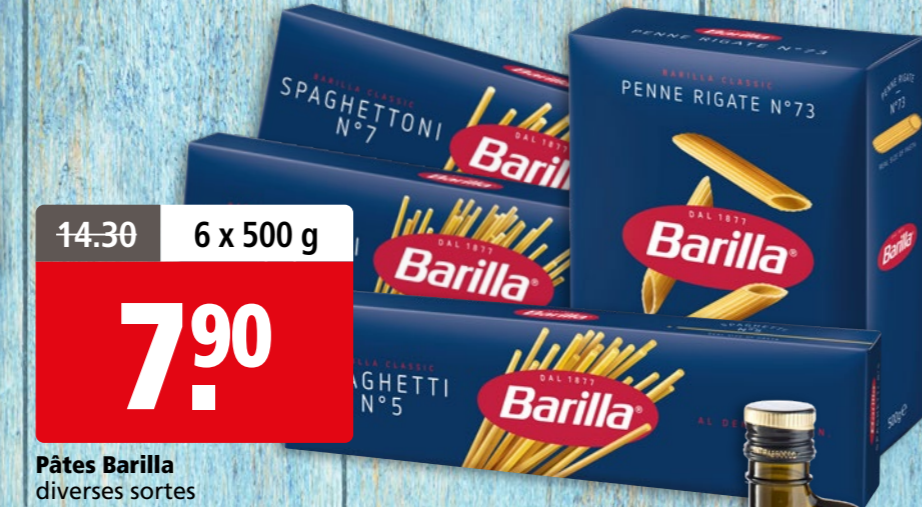
Pâtes Barilla diverses sortes