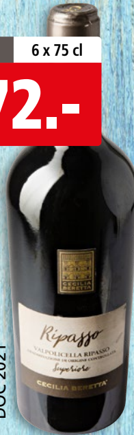
Valpolicella Ripasso Superiore Cecilia Beretta DOC 2021