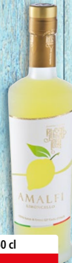
Limoncello Russo 1899 Amalfi IGP, 30% vol.