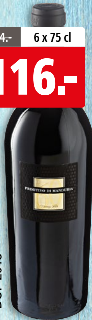
Primitivo di Manduria 60 Anni DOP 2018