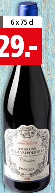
Amarone della Valpolicella Classico Villa Borghetti Pasqua DOCG 2019