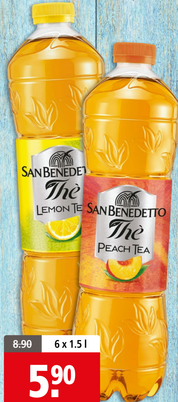
San Benedetto lemon ou peach