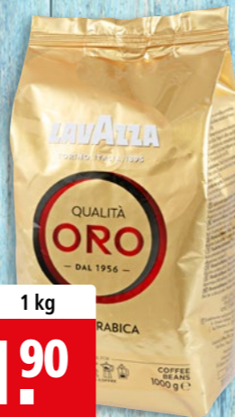
Café Qualité Oro Lavazza en grains