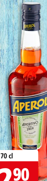
Apérol Bitter 11% vol.