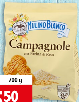
Campagnole Mulino Bianco