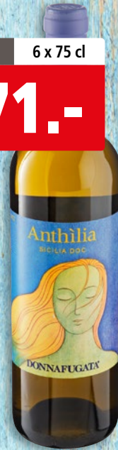
Anthilia Donnafugata Sicilia DOC 2022