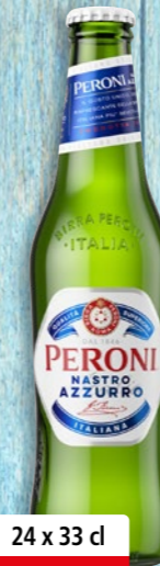
Peroni Nastro Azzurro