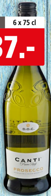
Prosecco Frizzante Canti DOC