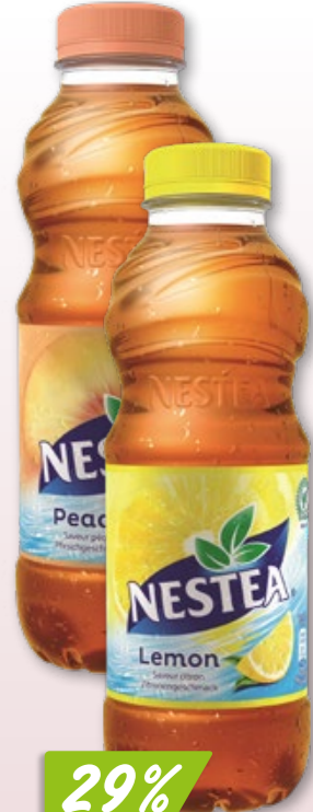
Nestea Lemon oder Peach 24 x