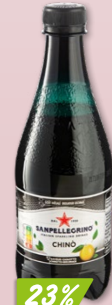
SanPellegrino Aranciata oder Chinotto 6 x 4