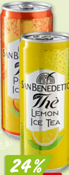
San Benedetto Lemon oder Peach 6 x