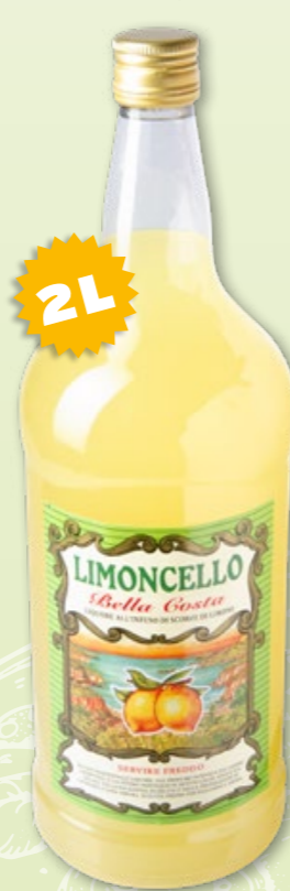
29430 Limoncello Amalfi Russo 1899 30% Vol., 6 x